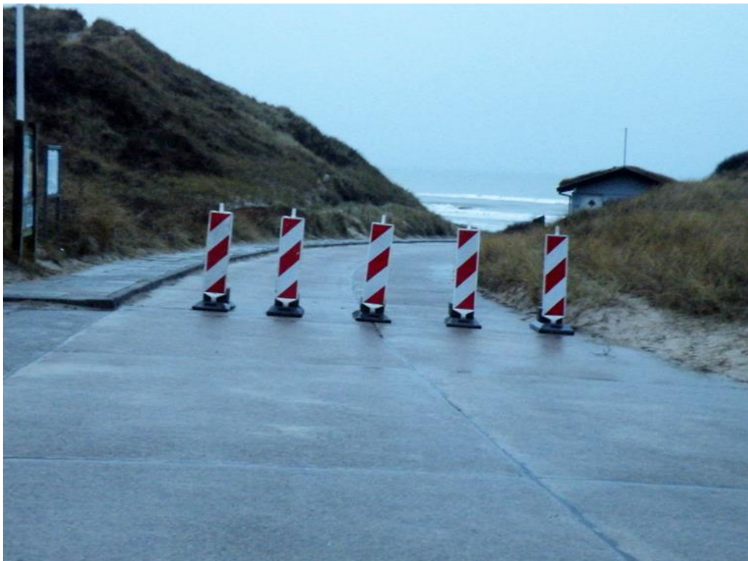
Kandedstedvejen røg også i havet som sædvanligt i december 2013