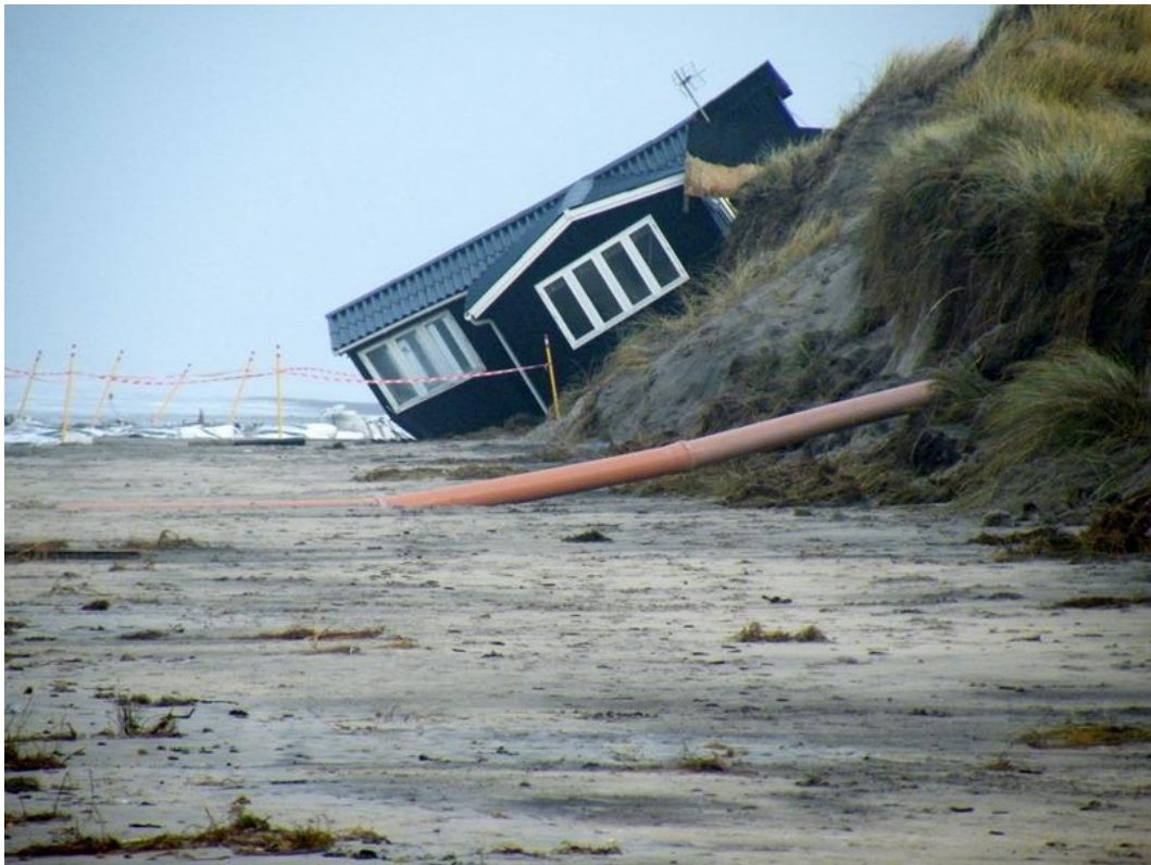
Tre huse på Nørlev strand røg i havet i december 2013